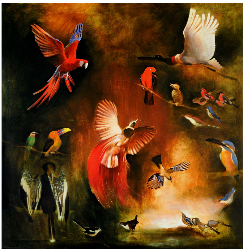
VINCZELLÉR IMRE: AVES olaj, vászon, 130x130 cm, 1999