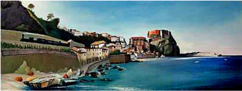
CSONTVÁRY KOSZTKA TIVADAR: Tengerparti város (Scilla) 45,5x117,5 cm, olaj, vászon, 1902