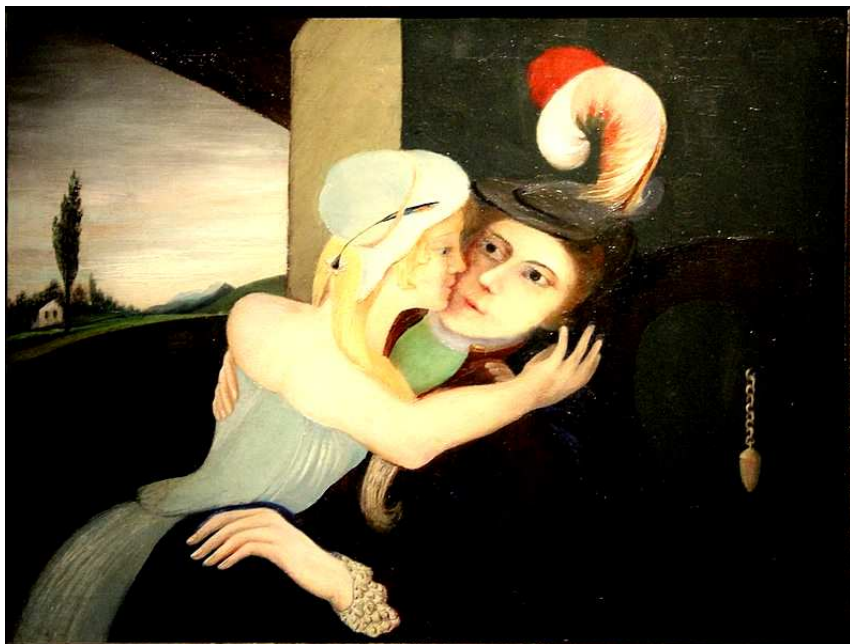
CSONTVÁRY KOSZTKA TIVADAR: Szerelmespár 50x65 cm, olaj, vászon, 1902 körül